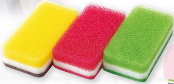
イエロー ローズ ライトグリーン