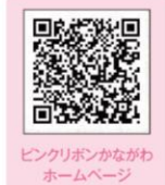
ピンクリボンかながわ ホームページ

ダスキン南関東地域本部では、2014年よりピンクリボンかながわの活動を応援しています。